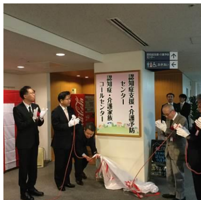
開設セレモニー：「認知症支援・介護予防センター」「認知症・介護家族コールセンター」の看板が初お目見え！