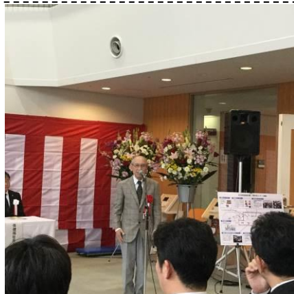
認知症とともに歩んで来た高田代表。念願の拠点施設の誕生に、万感の想いが溢れる感謝のスピーチをされました。