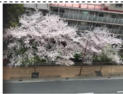
開設セレモニー当日の4月1日は、お隣の市立医療センターの桜が満開でした。