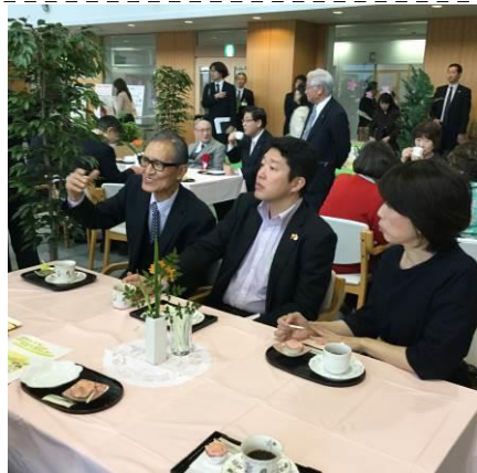
来場の皆さんにカフェコーナーを体験していただきました。コーヒーとお菓子でほっと一息。お話もはずみます。♪～