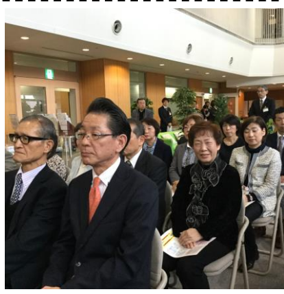
当日はおよそ80名の方々の来場がありました。みんな笑顔です！